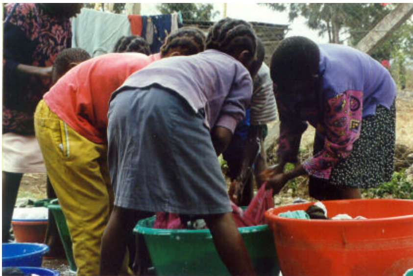
Le bambine mentre fanno il bucato