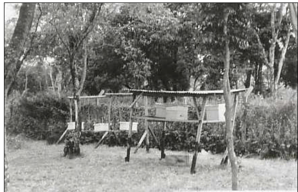
Le arnie con le api

Quest'anno grazie a vari finanziamenti si sono potuti realizzare: